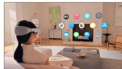
Con el Apple Vision Pro se pueden ver apps en el espacio físico.