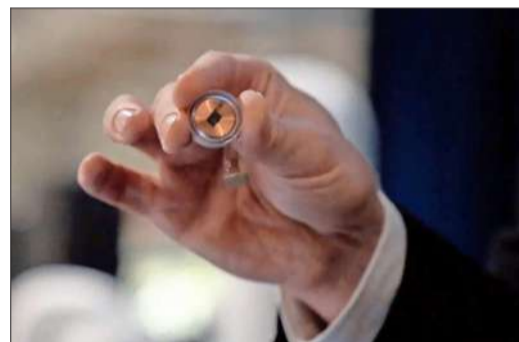
El implante de Neuralink, en la foto, busca conectar el cerebro con dispositivos electrónicos.

Si bien, dice que "en los últimos 10 años se ha avanzado en la precisión con que esto se hace, gracias a