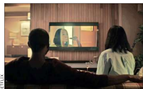
Joan y su pareja empiezan a ver el episodio "Joan is Awful", que se creó, en parte, con inteligencia artificial generativa.

Después de terminar su día, Joan prende el televisor y se sorprende al ver una serie en una plataforma de streaming que narra su propia vida con inquietante precisión. Así comienza "Joan is Awful", el primer episodio de la sexta temporada de la serie, que explora cómo una mujer descubre que su día a día está siendo convertido en contenido en tiempo real, gracias a la inteligencia artificial (IA) generativa y otras tecnologías.