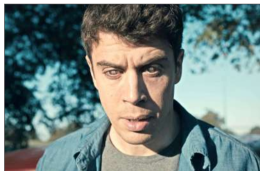
Con un implante cerebral, el protagonista revisa compulsivamente sus recuerdos.

Actualmente, añade, "las interfaces cerebro-máquina buscan ayudar a gente que no puede mover sus extremidades porque tienen daño en la médula espinal, ya que el aparato registra la actividad eléctrica de neuronas de