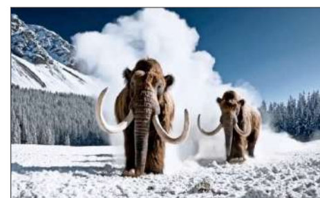
En la imagen, se puede observar una captura de un video generado por Sora, el modelo de IA de texto a video de OpenAI.

No obstante, esta tecnología no está exenta de críticas. De hecho, fue uno de los temas centrales de la huelga de actores de Hollywood en 2023, quienes pedían que se regulara su uso.