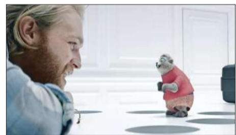
Después de su implante cerebral, Cooper empieza a ver elementos virtuales.

En la vida real, se ha avanzado en este ámbito con lanzamientos como el Apple Vision Pro (2024), que combina contenidos digitales, tal como aplicaciones, con el espacio físico.